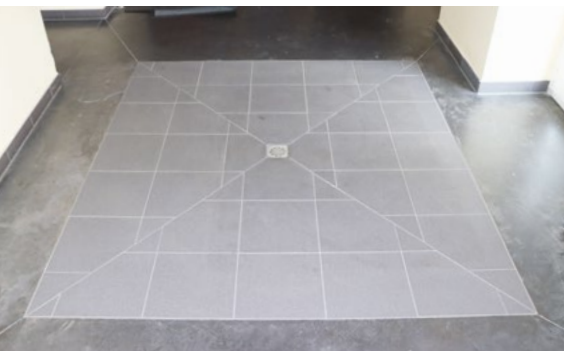
Im Festsaal von Heisdorf wurde ein Abfluss eingesetzt.