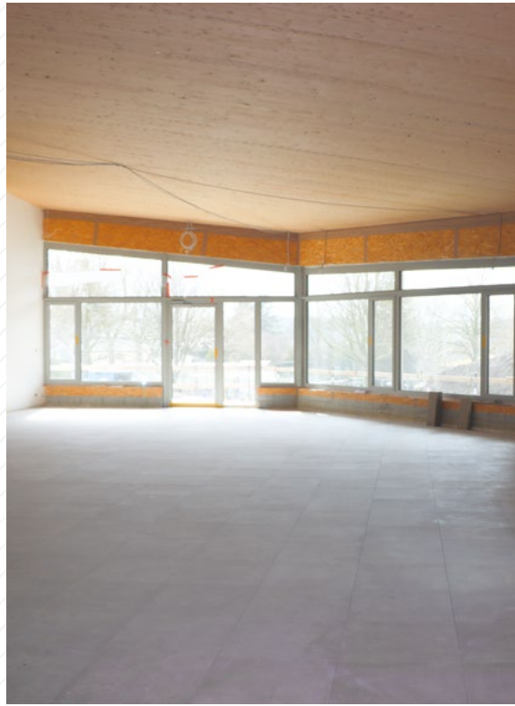
Die Innenausbauarbeiten im Festsaal von Asselborn gehen weiter.