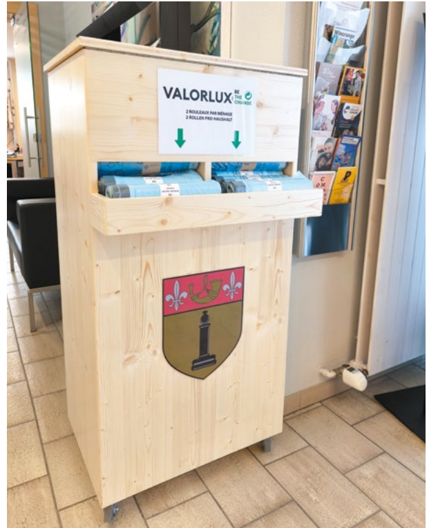
Neuer Spender für Valorlux-Tüten.