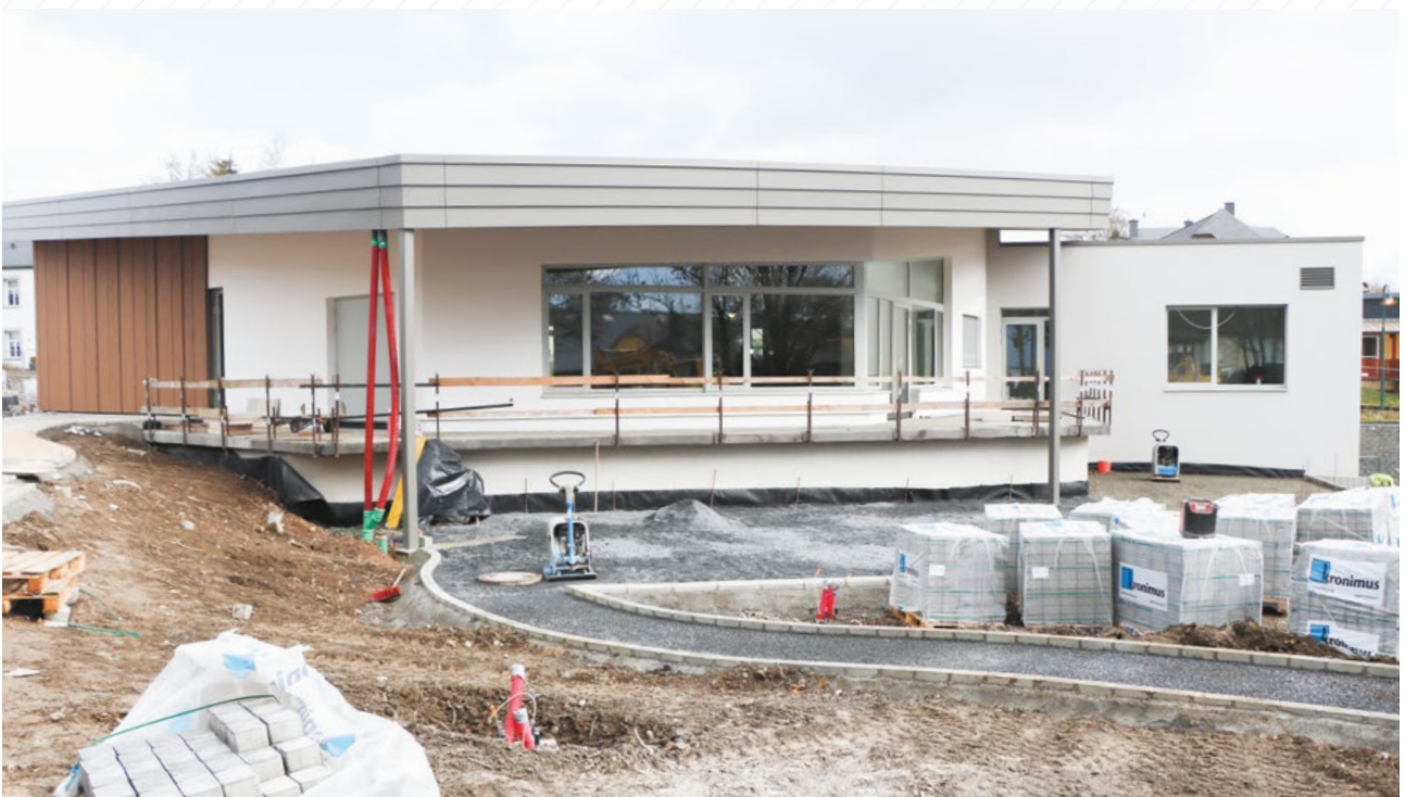
Gestaltung der Umgebung rund um den neuen Festsaal in Asselborn.