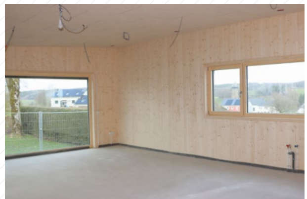
Die Arbeiten für die Minicrèche in Helzingen gehen voran.