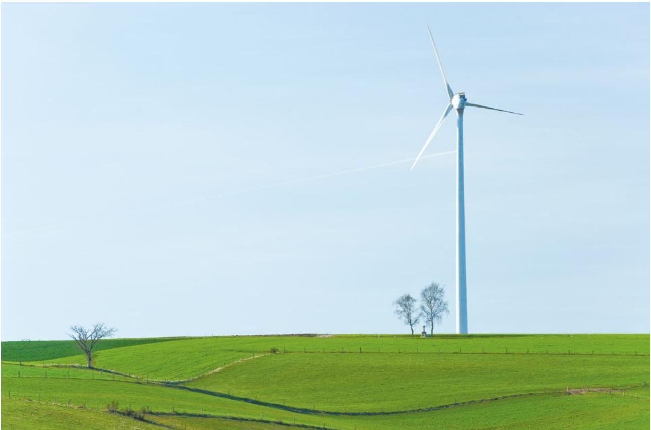
Landschaft Eolienne