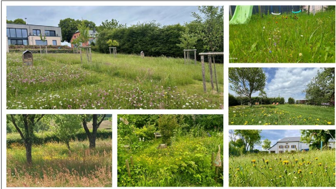
Fotoen an der Virauswiel vum Gewënnspill 2025 (© Privat).

De Fotoconcours vum Naturpark Our huet eng grouss Resonanz fonnt. Méi wéi 30 Leit hunn hir Fotoen agereecht, iwwer déi duerno online ofgestëmmt gouf. Iwwer 170 Stëmme sinn dobäi zesumme komm. Ausgezeechent goufen opfälleg bléi- a aarteräich, souwéi fotografesch besonnesch gelongen Opnamen.