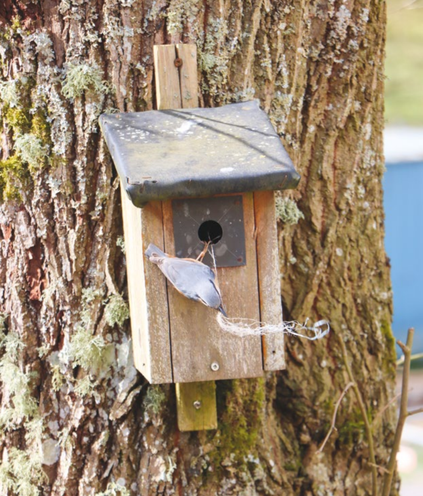
Frühling in der Gemeinde