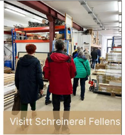
Visitt Schreinerei Fellens