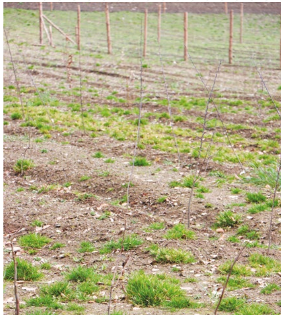
Neue Bäume wurden in Wintger gepflanzt.