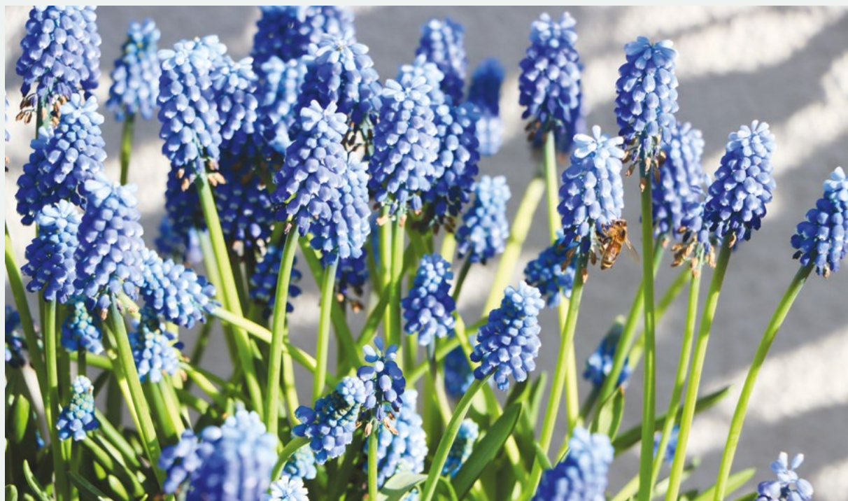
Frühling in der Gemeinde