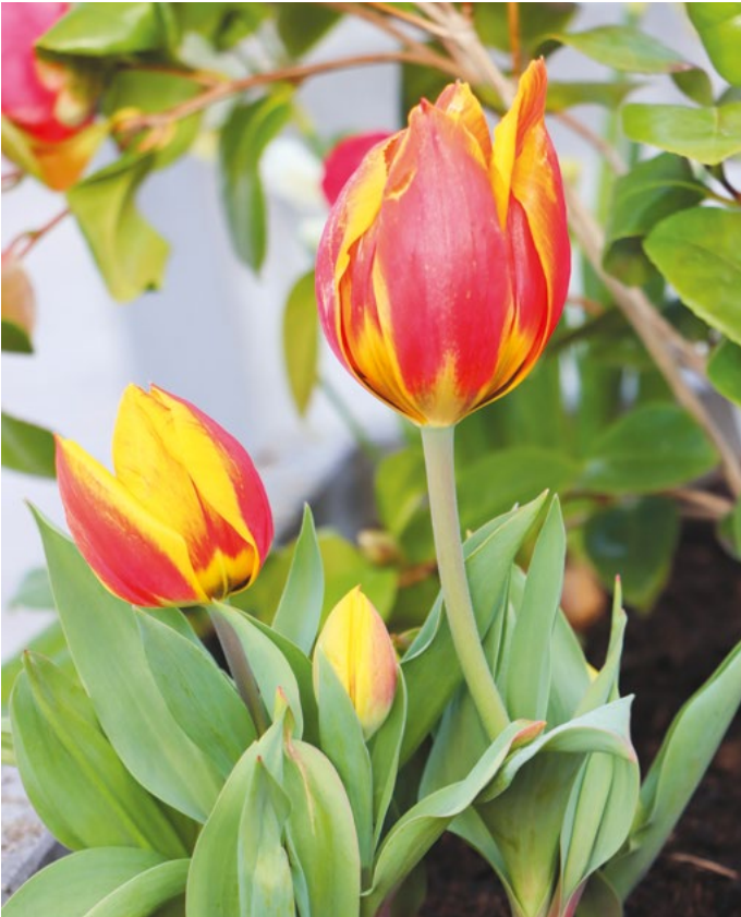
Frühling in der Gemeinde

Bürgermeister Meyers (CSV) erklärt, dass man bei mehreren „Agents“ einen Schichtplan einführen könne, sodass eine Kontrolle abends und an den Wochenenden gewährleistet sei. Er verweist erneut darauf hin, dass die einzustellende Person nicht nur zum Protokollieren da sei, sondern auch um das Gespräch mit den Bürgern zu suchen und die Bevölkerung zu sensibilisieren.