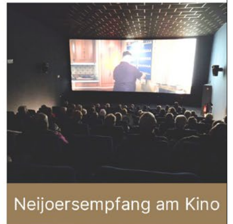
Neijoersempfang am Kino