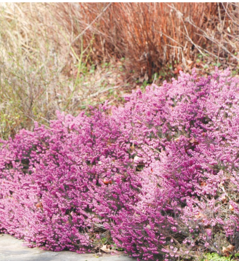
Frühling in der Gemeinde

Le bourgmestre Meyers (CSV) répond qu'après concertation avec le SIDEN, il s'avère que le potentiel