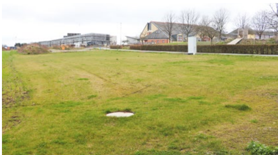
In Wintger kann der Parkplatz Richtung Lullingen gebaut werden.