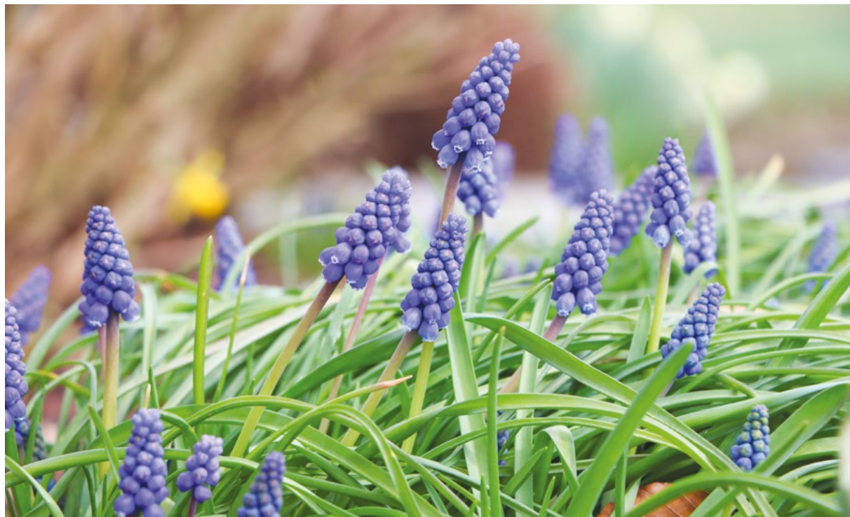
Frühling in der Gemeinde