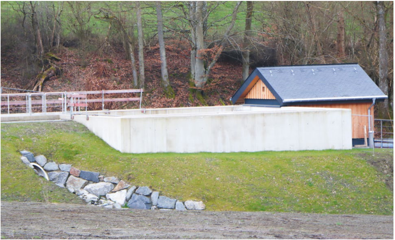
In Boxhorn kommen die Arbeiten für das Regenüberlaufbecken zu Ende.