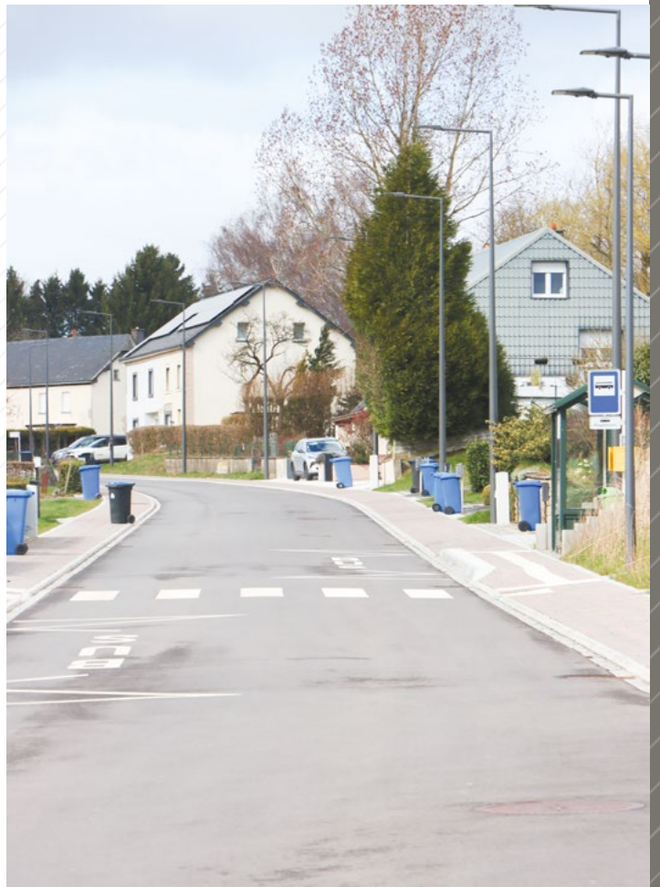
Die Straßenarbeiten in Boxhorn sind fertig.