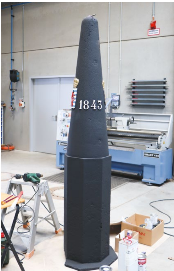
Der Grenzstein von Hoffelt wurde restauriert.