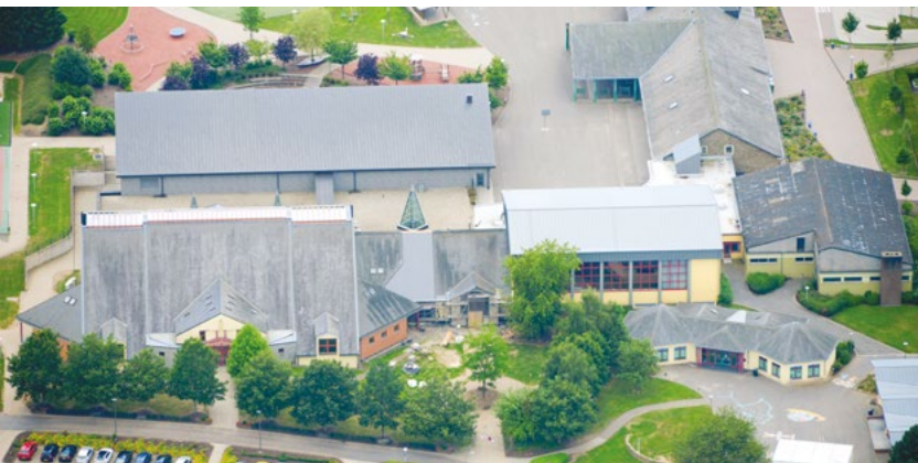
Sporthalle in Wintger / Hall sportif de Wincrange

Bürgermeister Meyers (CSV) erklärt, dass das Dach der Halle seit Jahren undicht ist und deshalb eine Renovierung notwendig ist.