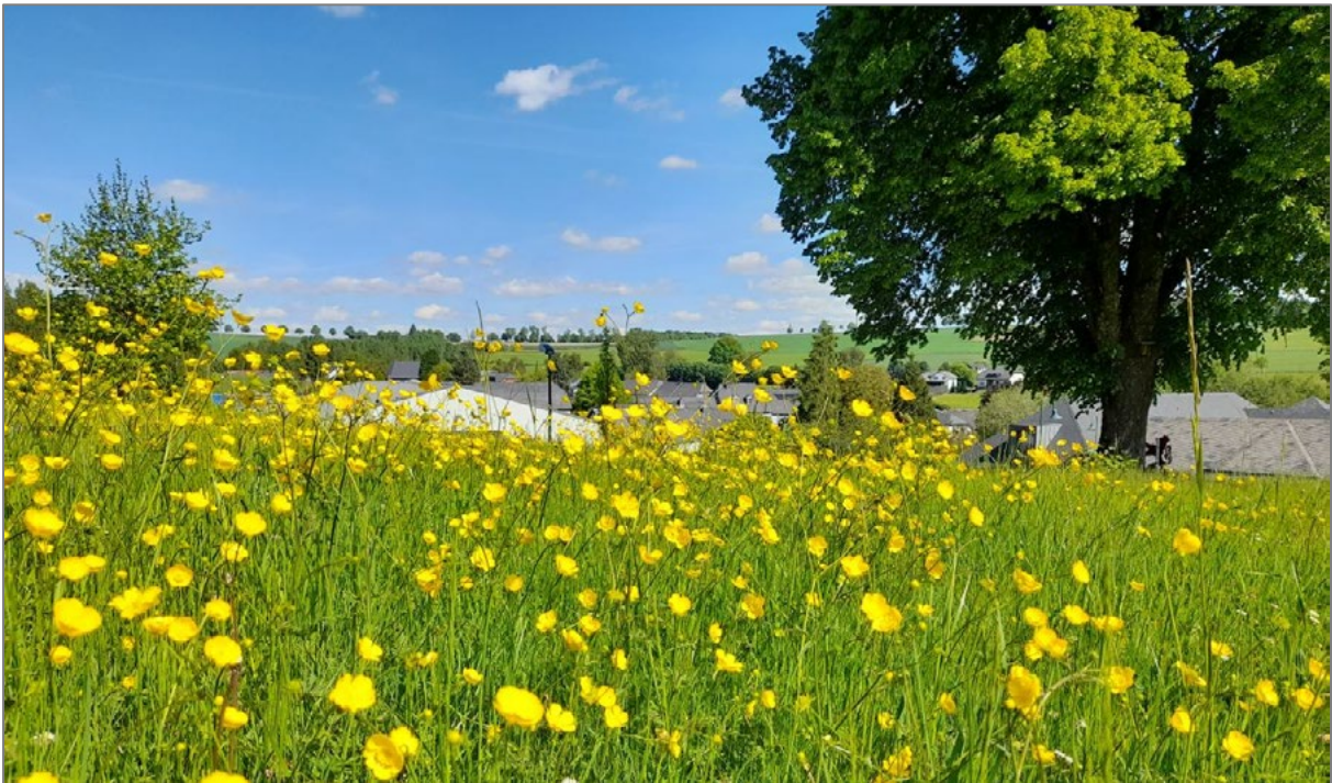
Lëllgen, Gemeng Wëntger.

Mat der Initiativ „Méi net am Mee“ setzt den Naturpark Our zanter e puer Joer e kloert Zeeche fir de Schutz an d'Förderung vun der Biodiversitéit am Siidlungsraum. D'Iddi ass einfach: Gréngflächen am Mee net méien, sou datt Wëllblummen zur Bléi kommen an Insekten an aner Déierenarten Narungs- a Liewensraim fannen. Dës ugepasste Méipraktiken droen am private Beräich wéi och op öffentleche Flächen e wichtege Bäitrag zum Erhalt vun eisen eenheemesche Wëllplanzen an -déieren bäi.