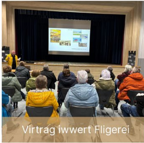
Virtrag iwwert Fligerei