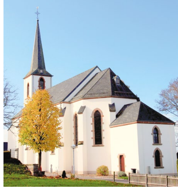
Kirche Boxhorn / Eglise Boxhorn

Bürgermeister Meyers (CSV) bedankt sich beim Tauschpartner, dass dies ermöglicht wurde.