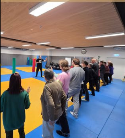
Self-Defense zu Wëntger