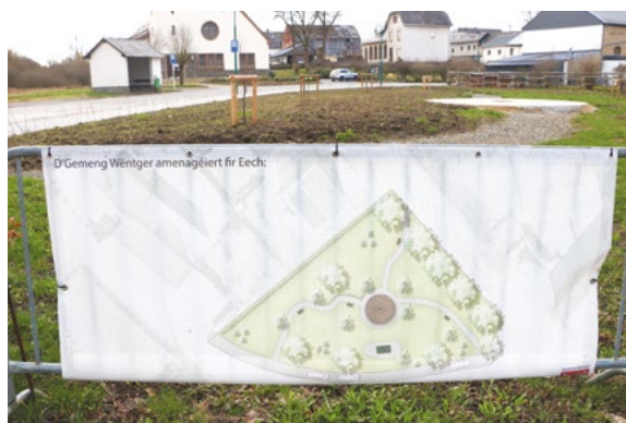
Gestaltung des Dorfplatzes mit Pavillon in Hoffelt.