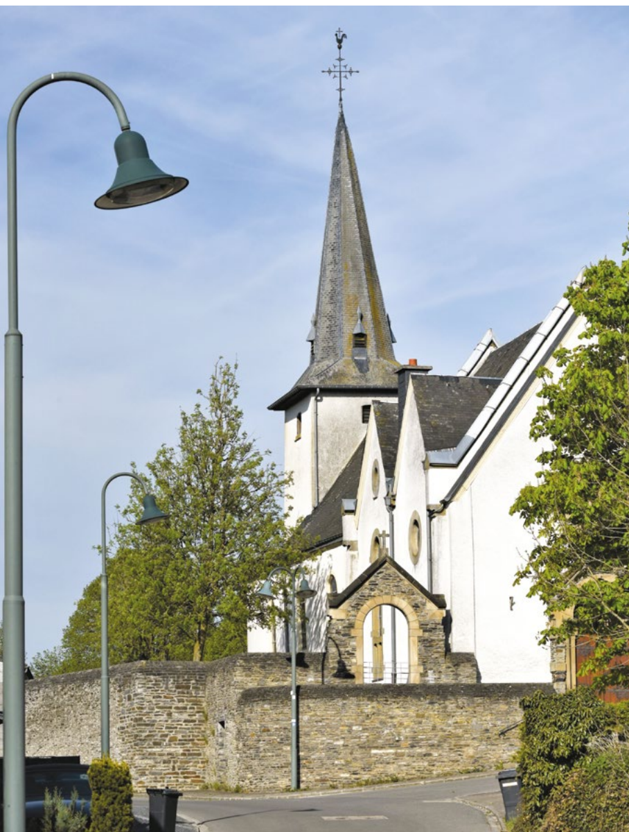
Kirche Saint-Sylvestre in Troine

Einstimmig beschließt der Gemeinderat dem Vorschlag des Kulturministers vom 18. November 2025 zuzustimmen, auf Antrag der Gemeinde die Kirche Saint-Sylvestre, die im Kataster der Gemeinde Wintger, Sektion BA von Trotten, unter den Nummern 63/2632, 64/2633, 65/2634, 62/2631, 62/2630 und 61/2629, die der Gemeinde Wintger gehört, als nationales Kulturerbe einzustufen.