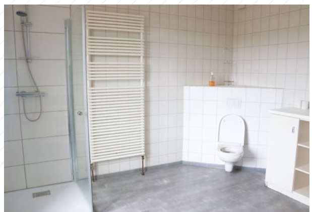
Wohnungen in Schimpach wurden renoviert.