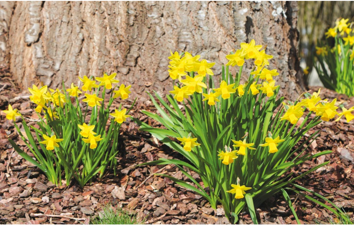
Frühling in der Gemeinde