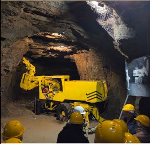
Musée des mines- Rémeleng