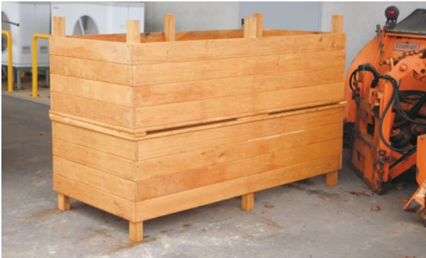
Bau von zwei Hochbeeten für die Maison Relais.