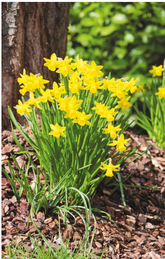
Frühling in der Gemeinde