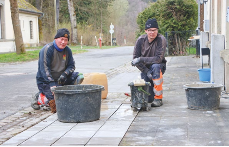
In Schimpach wurde der Bürgersteig repariert.