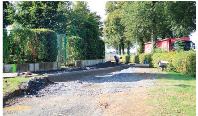
Réaménagement du trottoir le long de la maison relais vers la commune après le chantier en septembre 2024.

Boevange „Duerefstrooss“: plantation de haies, installation de fascines et d'une grille d'écoulement, prolongation de la canalisation, relèvement d'un mûr existant et mise en place d'un