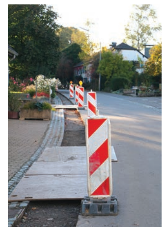
A villen Dierfer gien de Moment nei Glasfaserleitungen von der Post ageluegt. Dëst fir d'Internetverbindungen ze verbessern