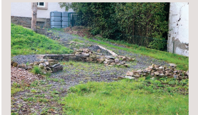
De Gemeinschaftsgaart zu Boxer bei der Kiirch.