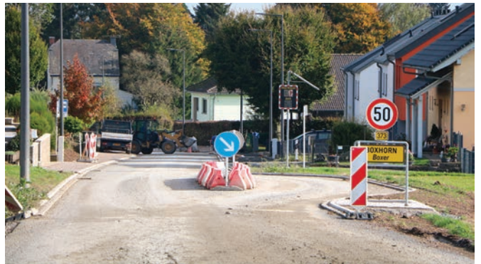
Um Gisel, am Agang van Boxer kënnt eng Hindernis-Insel fir d'Vitesse vun den Autofuerer rofzekerien .