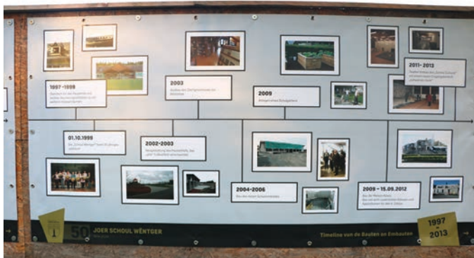
Grouss Fotoausstellung 50 Joer Schoul – kommt se all besichen – vill Erënnerungen.