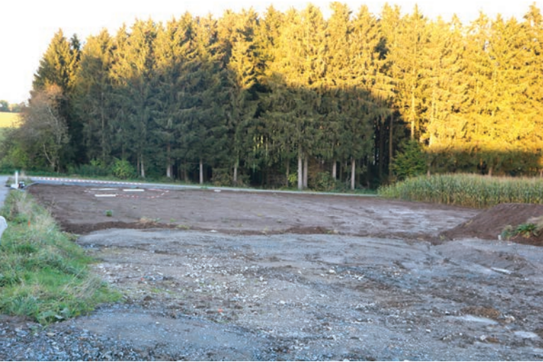
Zu Wëntger bei der Schoul Richtung Lëllgen ass net mei vill vum groussen Regenüberlaufbecken ze gesinn .