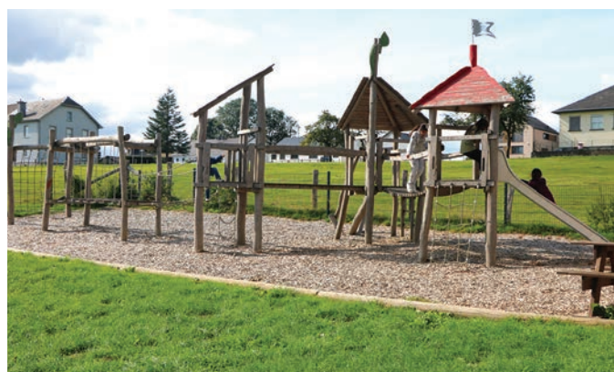
Aire de Jeux à Hamiville derrière la salle de fête.

Le conseil communal approuve les différentes mesures supplémentaires à l'unanime afin d'atteindre les critères minimaux exigés.