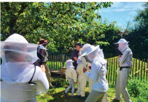
Besichtigung beim Imker