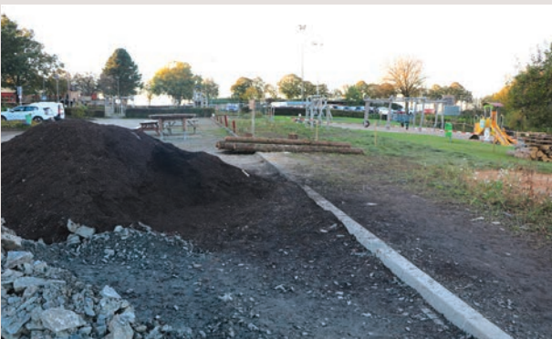
D'Spillplaz beim Fussballsterrain, esou wei d'Paarkplaaen sinn nees zougänglich an gin zreck aménageiert.