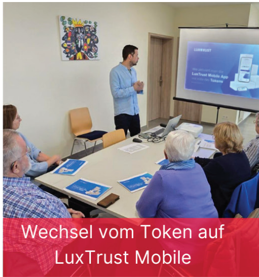
Wechsel vom Token auf LuxTrust Mobile