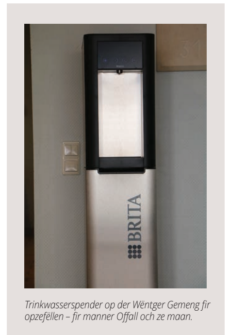
Trinkwasserspender op der Wöntger Gemeng fir opzefellen - fir manner Offall och ze maan.