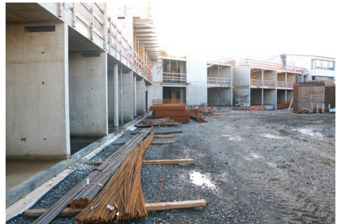
Engt neit Bildungshaus entsteet.