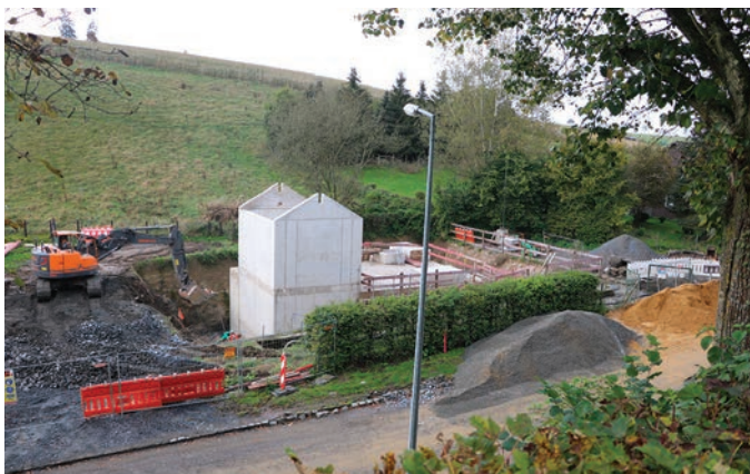
Zu Boxer gëtt Richtung Clärrief een Regenüberlaufbecken Rüb gebaut.

Schöffe Thillens (DP) verweist auf einen Problembaum bei der Kirche in Boxer.