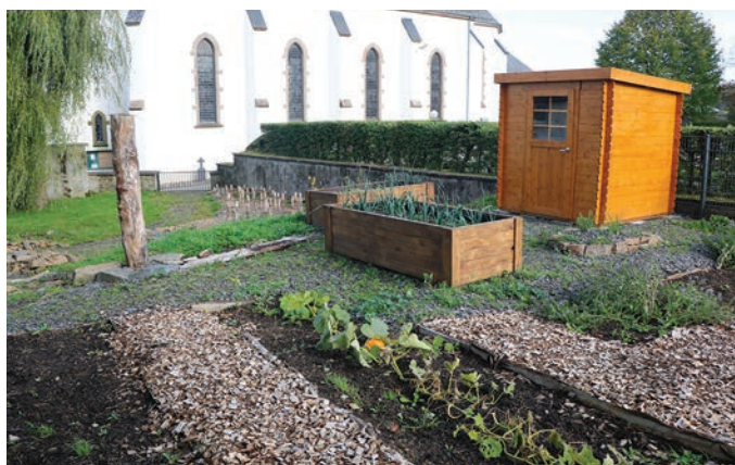
De Gemeinschaftsgaart zu Boxer bei der Kiirch. Ween interessiert hei matzschaffen, kann sech op der Gemeng informieren.