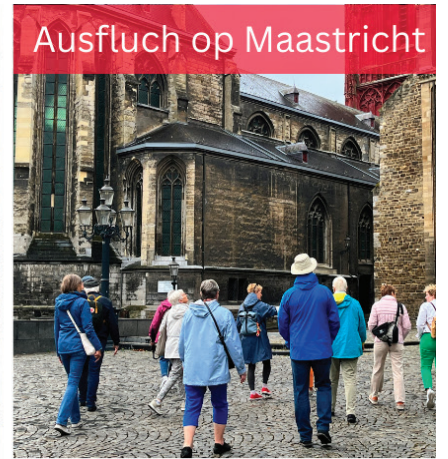
Ausflug op Maastricht