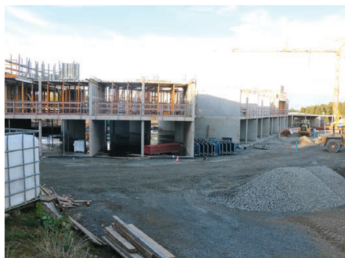
La construction de la nouvelle école avance bien.

Étant donné que deux votes restent à réaliser, ce point est également reporté à la prochaine séance.