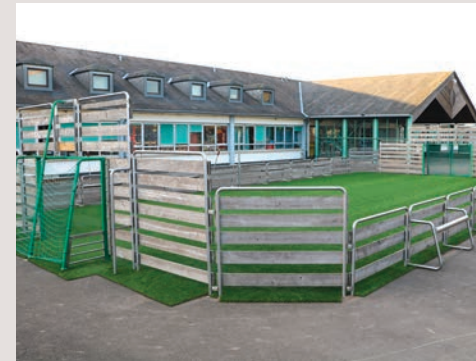
Durich den groussen Chantier ass den aktuellen Schoulhaff deelweis reduzeiert gin.