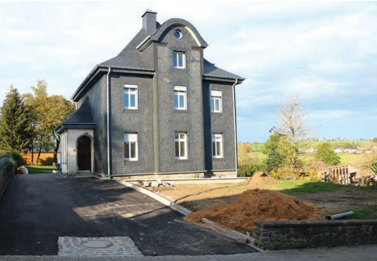
D'Paschtouischhaus zu Dänjen gött ronderem nei aménageiert.