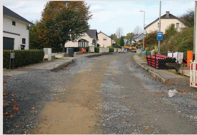
An der Hauptstrooss zu Boxer waerten Kanal-Waasser-Elektrisch-Post-Arbichten bis gudd an d'Joer 2025 undauern bis datt d'Strooss matt neien Stroossenluuchten an Trottoir faerdig waert sin.