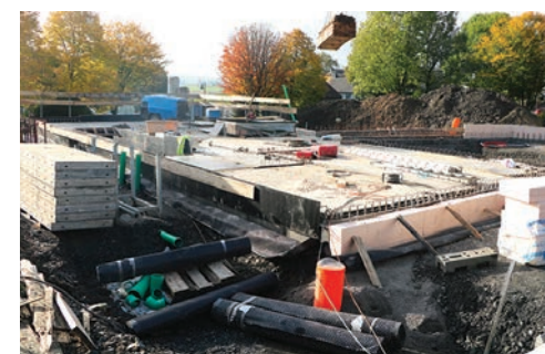
De Bau vum neie Veräinssall zu Asselbuer am Weiergart.