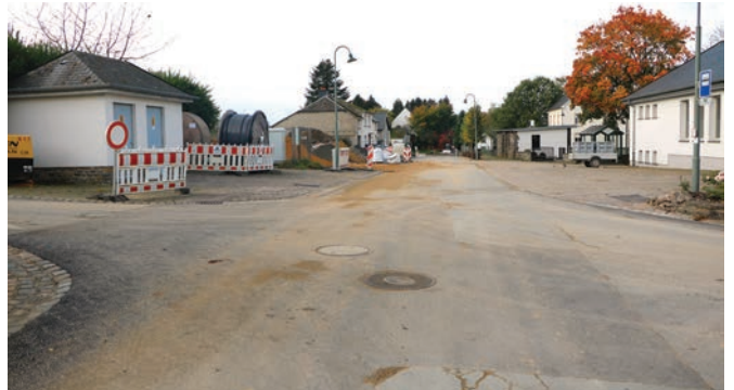
D'Leitungen vun der DEA sinn och färdig zu Boxer "um Béicherich" bis op d'Krauzung verlaaf.