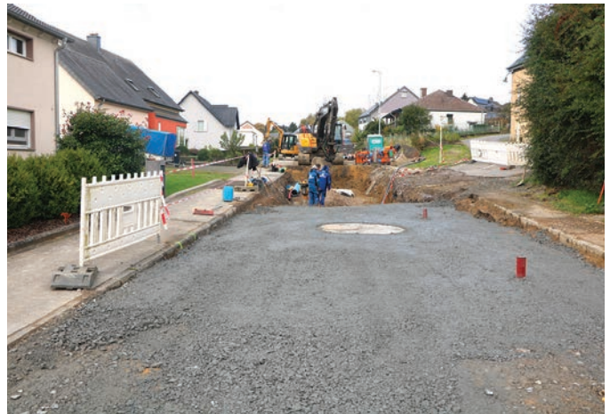
An der Hauptstrooss zu Boxer waerten Kanal-Waasser-Elektrisch-Post-Arbichten bis gudd an d'Joer 2025 undauern bis datt d'Strooss matt neien Stroossenluuchten an Trottoir faerdig wäert sin.

Nach der obigen Abstimmung wird über die diesbezüglichen Punkte des grafischen Teils des PAG nach Kadastersektion abgestimmt.