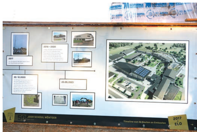
Grande exposition de photo extérieure sur 50 ans d'école à Wintger - venez la visiter .

Le conseiller Hoffmann (LSAP) se renseigne quant à la location de gobelets réutilisables proposée par le Forum pour l'emploi.