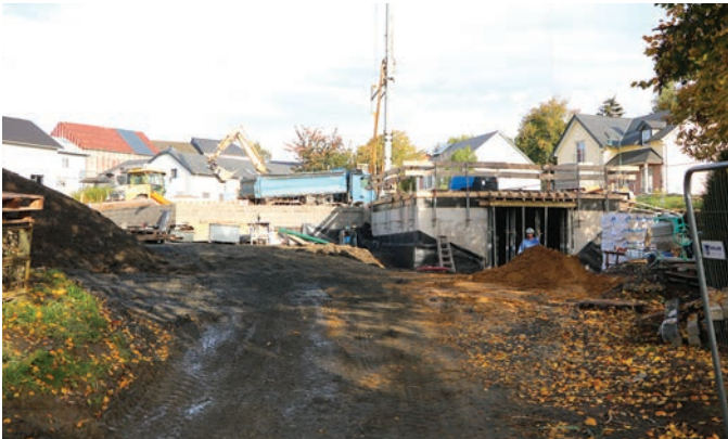
De Bau vum neie Veräinssall zu Aasselbuer am Weiergaart.