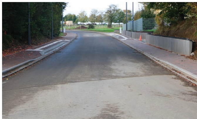
Boxhorn: Travaux routiers: Les trottoirs dans la rue «Om Gisel» sont en cours de finalisation.

La maison des jeunes pourra dès lors utiliser une partie du