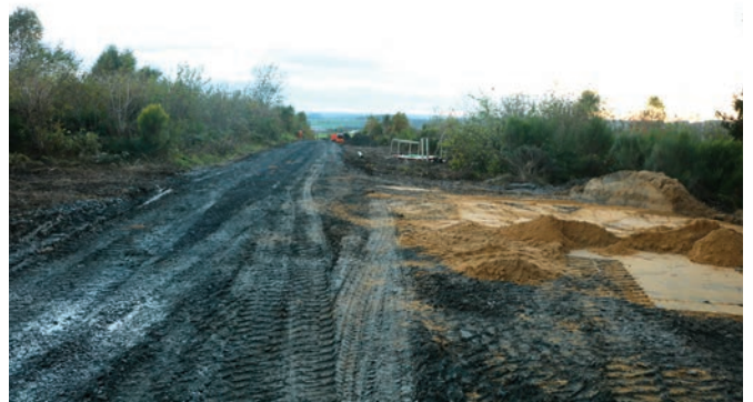
Op der Féitsch entsteet een neien groussen Waasserbehälter.