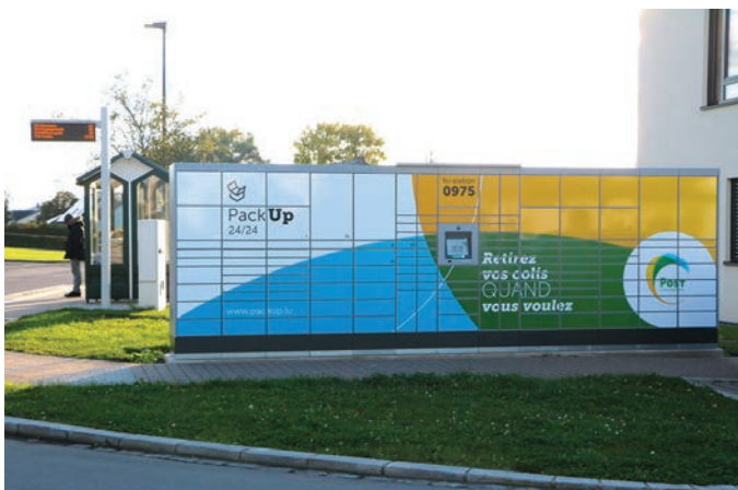
PackUp 24/24 bei der Wëntger Gemeng.

Schöffe Arend (CSV) antwortet, dass man lediglich die Möglichkeit prüfen sollte, den bisher genutzten Abfallbehälter gegen ein kleineres Modell zu tauschen.