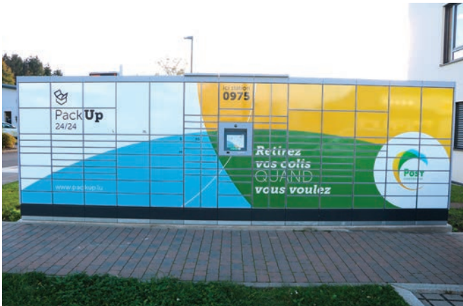
Post huet zu Wëntger bei der Gemeng eng nei Pack-Up Statioun installéiert.