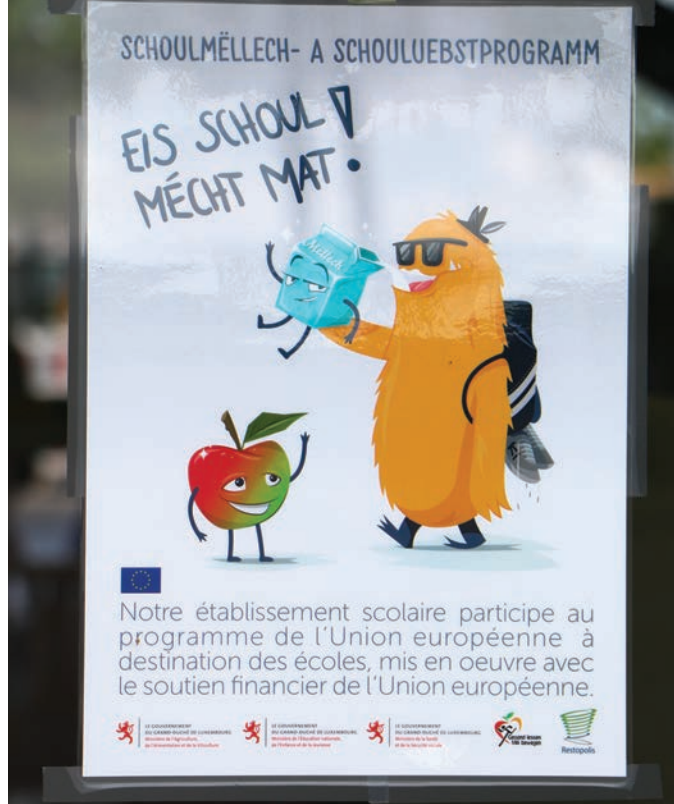
Schoulmëllech – a Schouluebstoprogramm – Eis Schoul mecht mat!.

• Der Vizinalweg, welcher von Allerborn bis hin zur N12 vor Derenbach sowie nach Oberwampach führt, wird vom 10.06.2024 bis zum Abschluss der Arbeiten für jeglichen Straßenverkehr gesperrt.