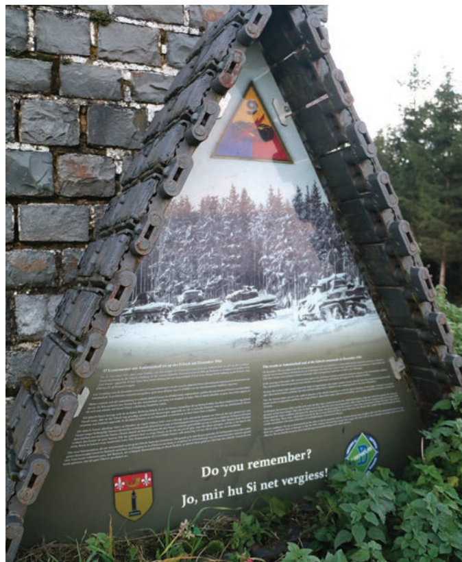
Op der Féitsch beim aalen Waasserbehälter ass een Denkmal "Jo, mir hu Si net vergiess!".