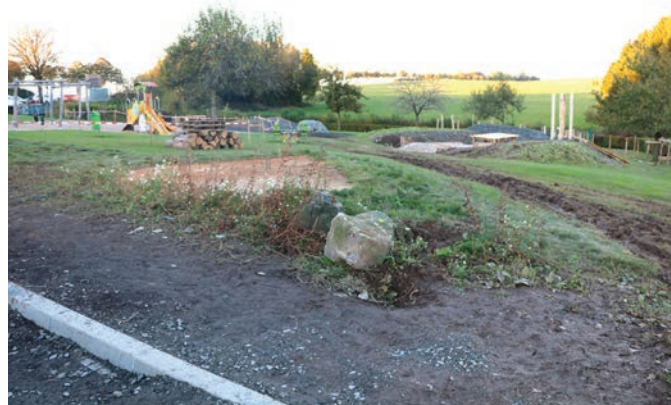
L'aire de jeux à côté du terrain de football sera à nouveau réaménagée par le grand chantier cet été 2024.

Les parcelles concernées par une partialité d'un conseiller