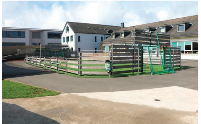
Durich den groussten Chantier ass den aktuellen Schoulhaff deelweis reduziert gin an emorganisiert gin.

Förster Schmitz erläutert weiterhin, dass 2.000,-€ vorgesehen sind um etwaige Infrastruktur und/oder Pflegearbeiten auf der Parzelle des zukünftigen Waldfriedhofs zu tätigen. Diesbezüglich müssen noch einige kranke Bäume gefällt werden. Diese werden, laut Abmachung mit dem Vorbesitzer der Waldparzellen, an diesen weitergereicht. Rat Engelen (ADR) fragt nach ob es keinen zentraleren Ort für den Waldfriedhof